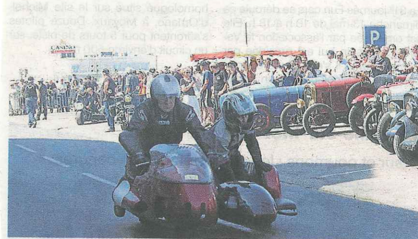
Le basset, un engin pour le moins original.

Organisée par la commune et le Rétro moto-club, cette 4 e édition de Jour de fête devrait se dérouler sous le soleil.