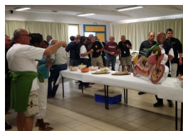
La réception par la municipalité de Luc et le RMC de l'avant-dernière étape du Tour de France