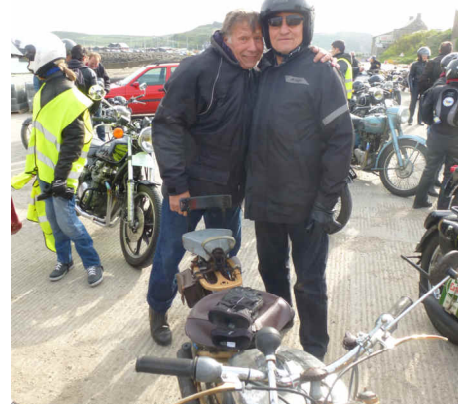
Le Rétro fit naître quelques amitiés