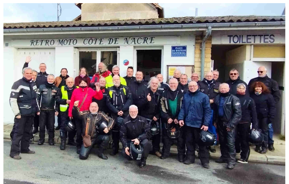
Non, ce n'est pas la queue pour les toilettes !

Une belle sortie hivernale, agréable et sympathique.