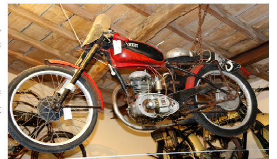
La Terrot compétition client de Claire Blaise

Elle se lance ensuite dans les courses de côtes avec entre autre une moto Terrot compétition client.